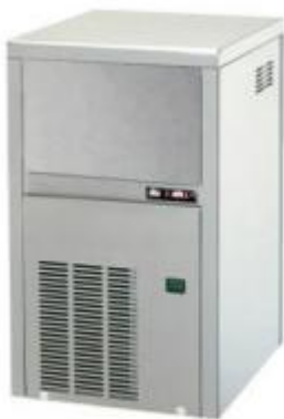
HV-C 20 13 GR